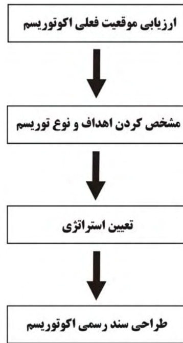
شکل ۱- فرآیند تعیین اهداف و نوع اکوتوریسم