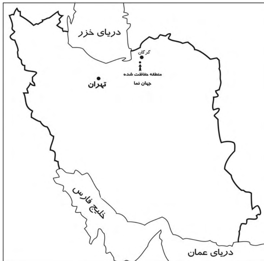
نقشه ۱- موقعیت منطقه حفاظت شده جهان نما در استان گلستان

گرفته و به طور کلی سه شکل کلی پوشش گیاهی منطقه حفاظت شده جهان نما عبارت است از «درختان پهن برگ به همراه علفزار، بوته زار به همراه ارس و درختچه های پهن برگ، ارس و بوته زار و علفزار (۱)». در جدول شماره ۱ پوشش گیاهی غالب در منطقه حفاظت شده جهان نما نشان داده شده است. جهان نما به دلیل شرایط خاص خود دارای زندگی جانوری غنی است و چندین گونه کمیاب و در خطر تهدید در آن یافت می شود مانند مرال، شوکا، قرقاول، انواع پرندگان شکاری. جهان نما دارای دو منطقه امن به نام های «ترکت با وسعتی معادل ۳ هزار هکتار و مغزی با وسعتی حدود دو هزار هکتار (۱) است که در واقع نوعی ناحیه بندی اولیه به شمار می روند. در داخل منطقه حفاظت شده جهان نما دو روستای دائمی زیارت در شمال شرقی و حاجی آباد در جنوب و دو منطقه بیلاقی کفشگیری محله و سعد آباد محله در دشت جهان نما وجود دارد که هرکدام ویژگی های فرهنگی، اجتماعی و اقتصادی خاص خود را دارند. اهالی روستای کفشگیری برای تفریح